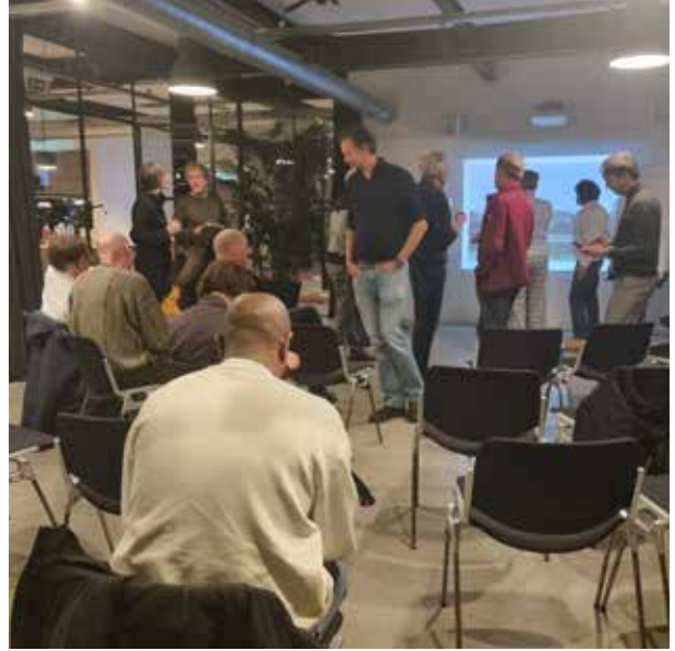
Atelier-bijeenkomsten in Studio Zeeburg op Zeeburgerpad.

(Stand van zaken op 3 december: wordt vervolgd!)