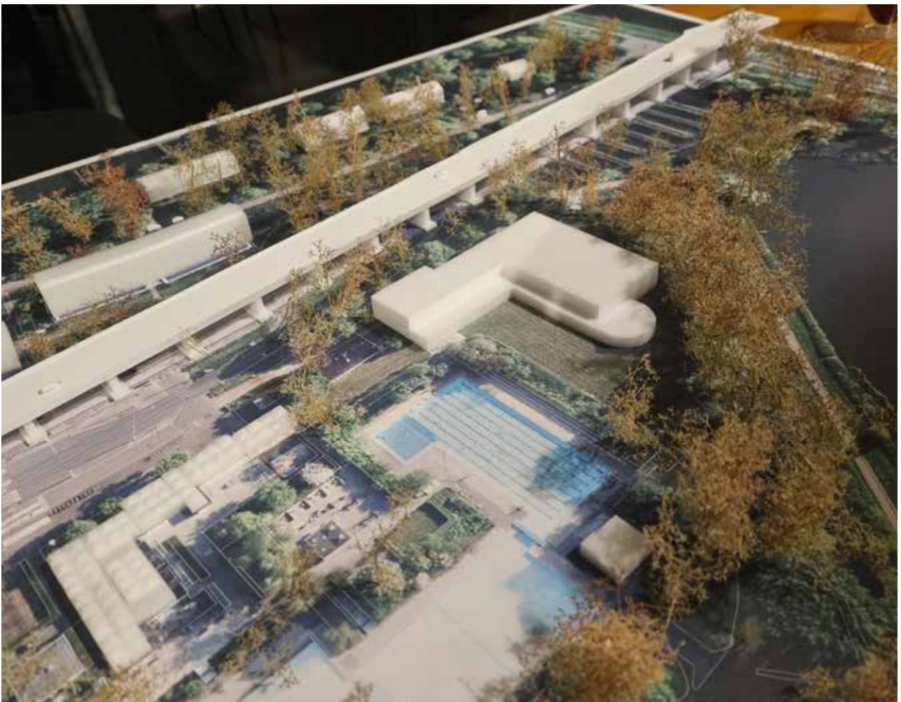
Maquette met geprojecteerde binnenbad.

In het derde “Atelier” van 20 november presenteerde het ontwerp bureau een voorkeursvariant. Om het unieke ontwerp en het culturele erfgoed van het huidige Flevoparkbad te behouden, is gekozen voor een binnenbad deels op de oostelijke ligweide. Dat betekent dat er bomen en groen gaan verdwijnen. Men geeft aan bomen en groen te compenseren via herplanting. Wij vragen ons af of dit haalbaar is.