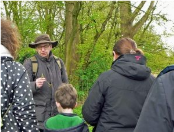
3 april - IVN vogelexcursie voor kinderen maart 2016 > start Werkgroep viering